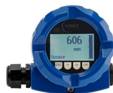
Tapa con ventana de visualización