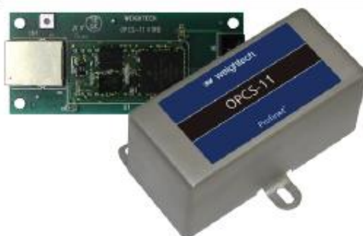
OPCS11 (cód. 502909)