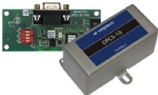
OPCS10 (cód. 502908)