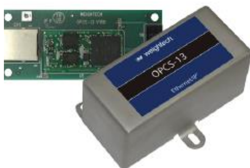
OPCS13 (cód. 502911)