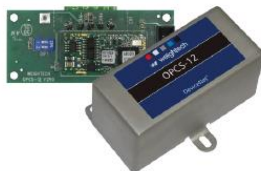
OPCS12 (cód. 502910)